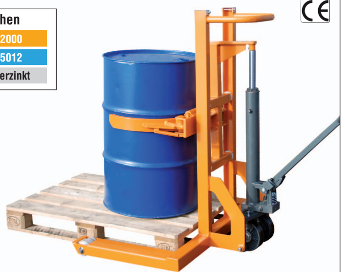
Typ FHR 600 K