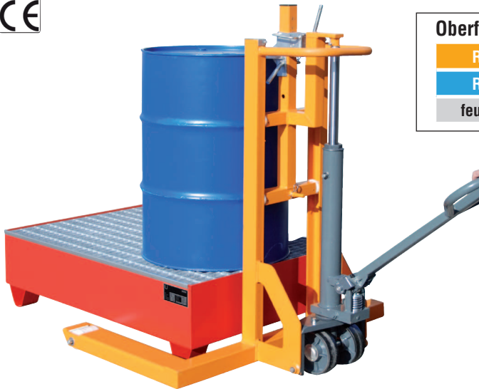
Typ FHR 600 G