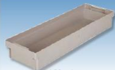
1/2 Einsatzkasten 1/2 box insert