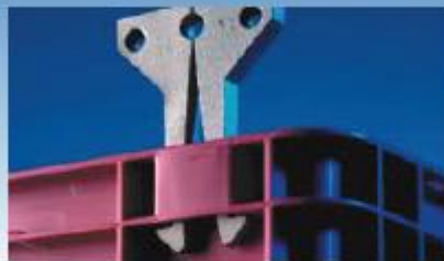
Aufnahme für Handlingsgeräte / location for automatic handling