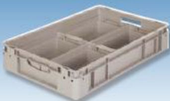
Behälter SL 6412 mit 4 x 1/4 Einsatzkästen container SL 6412 with 4 x 1/4 box inserts