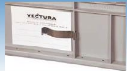
Federclip / clip