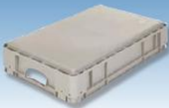
Glatte Boden / smooth base

b) 1/2 - 2 Einsatzkästen 560 x 178 x 80 mm 1/2 - 2 box inserts 560 x 178 x 80 mm