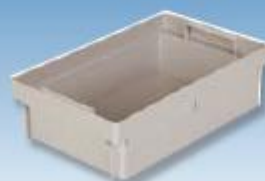
1/4 Einsatzkasten 1/4 box insert