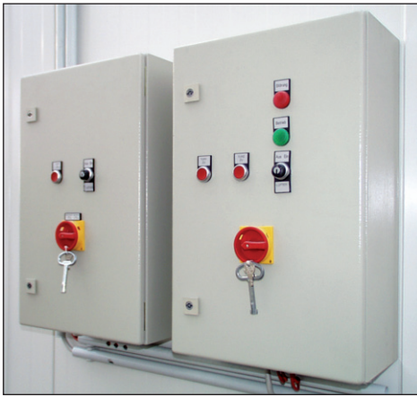
Schaltschrank mit Funktionstasten