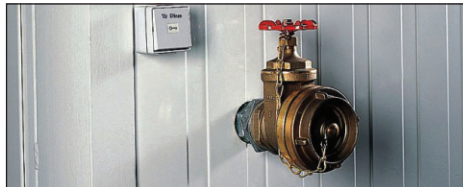
Anschluss für Schaumlöschanlage