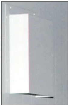
Zu-/Abluftöffnung mit Brandschutz