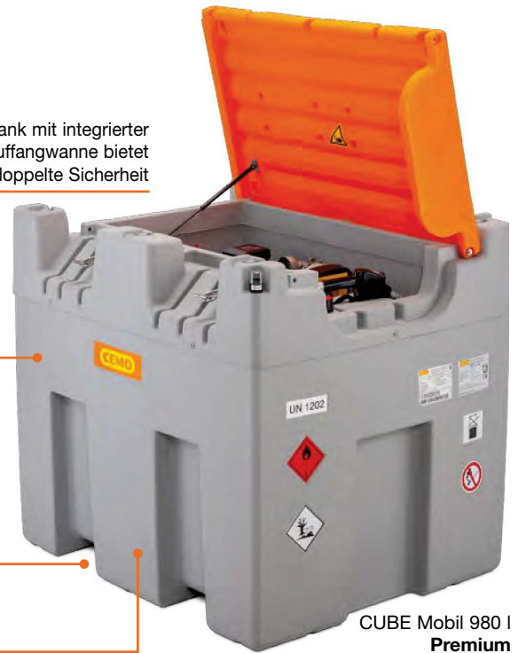
CUBE Mobil 980 L Premium

Zugelassen zur Lagerung und zum Transport