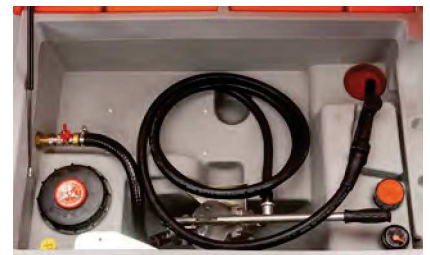
Ausführung mit Handpumpe 60 l/min