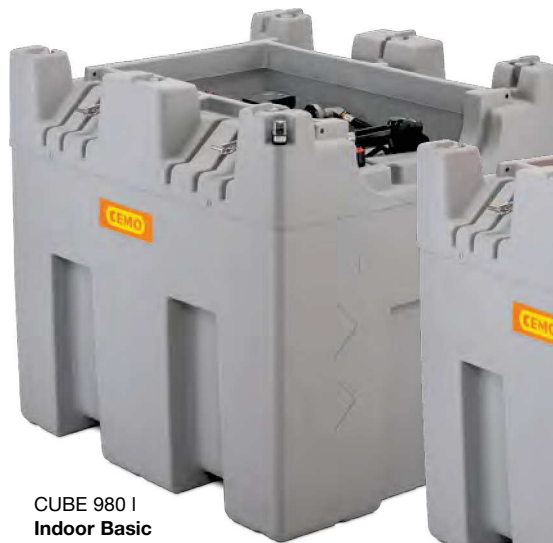
CUBE 980 I Indoor Basic