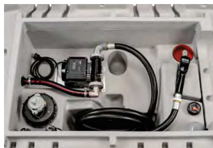
Indoor Basic 4 m Befüllschlauch DN 19, ohne Klappdeckel

Tank mit integrierter Auffangwanne bietet doppelte Sicherheit