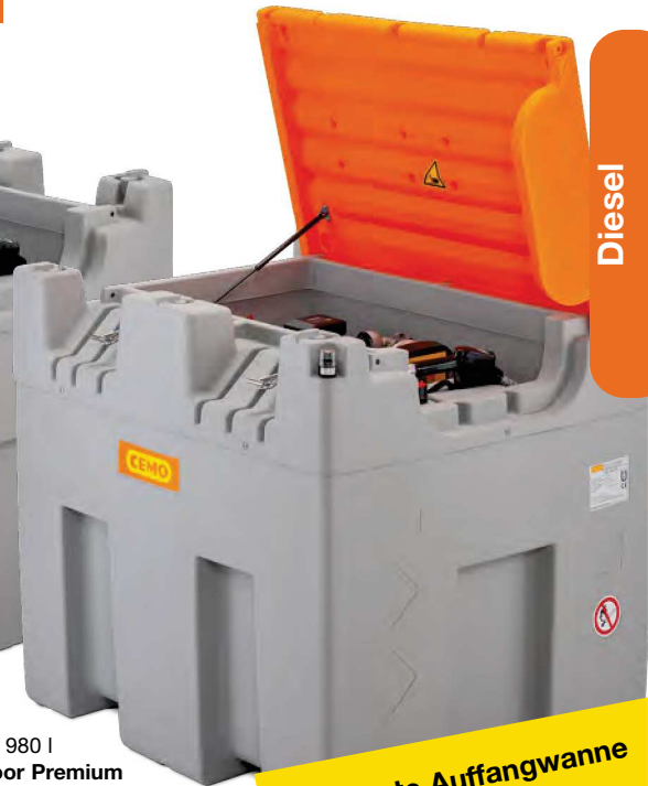
CUBE 980 I Outdoor Premium