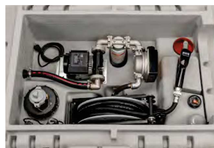
Indoor Premium Zähler K33, Filter mit Wasserabscheider, Schlauchaufroller mit 8 m Schlauch DN 19, ohne Klappdeckel