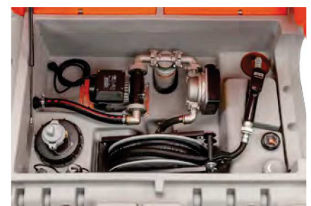
Outdoor Premium Zähler K33, Filter mit Wasserabscheider, Schlauchaufroller mit 8 m Schlauch DN 19, mit Klappdeckel