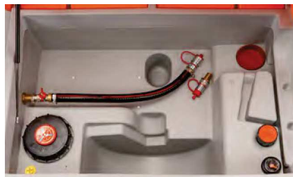
Ausführung ohne Pumpe mit Schnellkupplung

mit leistungsfähiger Elektropumpe, Schlauchaufroller mit 8 m Schlauch DN 25, Zähler, Filter mit Wasserabscheider und Automatik-Zapfpistole