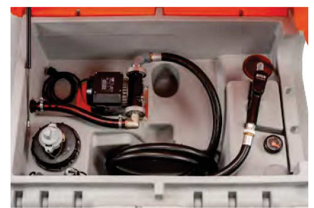
Outdoor Basic 4 m Befüllschlauch DN 19, mit Klappdeckel