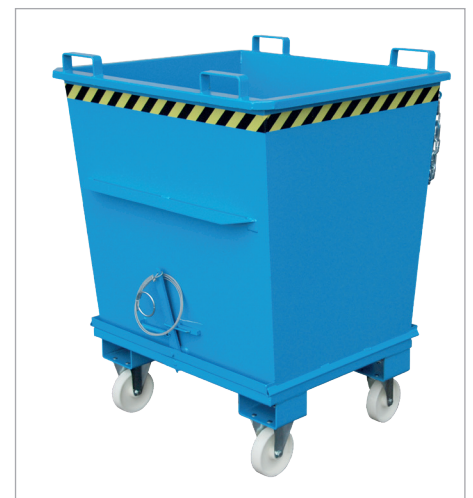
BKB mit Rollen