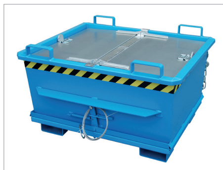
BKB mit Deckel