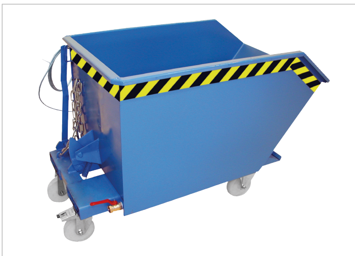
Typ SGU mit Rollen