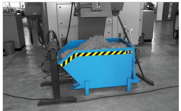
Typ SGU mit Stützfüßen