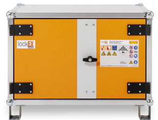
Produkt Frontalansicht geschlossen