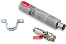
11561 - Aerosol- Löcher für Akku- Schrank WX20TH + BTA-CT-79