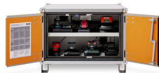
Produkt Frontalansicht offen mit beispielhaftem Inhalt bzw. mit Zubehör (nicht im Lieferumfang enthalten)