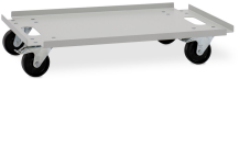
11461 - Rollengestell für Akku-Schrank 8/5