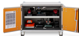
Produkt Frontalansicht offen mit beispielhaftem Inhalt bzw. mit Zubehör (nicht im Lieferumfang enthalten)