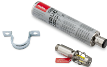
11561 - Aerosol- Löcher für Akku- Schrank WX20TH + BTA-CT-79