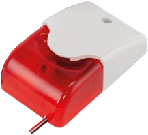
11389 - ABUS Kombi-Alarmgeber mit Montageanleitung