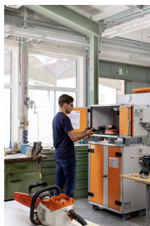
Produkt 12111 (8/5) und 12118 (8/10) Akkuschrack-Kombination K 8/17