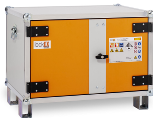
Produkt schräg von links geschlossen