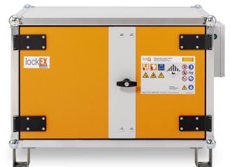
Produkt Frontalansicht geschlossen