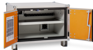
Produkt schräg von links offen