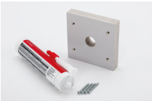
11345 - Kabeldurchführung für Li-Ladeschrank