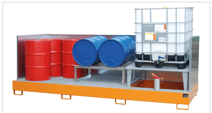
Typ AWA 31/SW + Typ FA 200-2