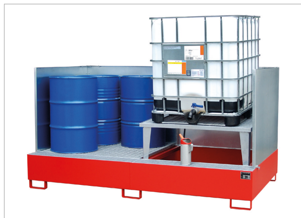
Typ AWA 21/SW