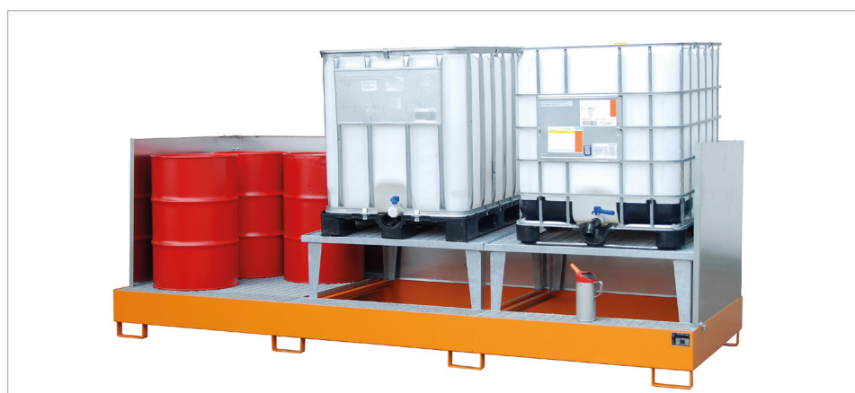
Typ AWA 32/SW