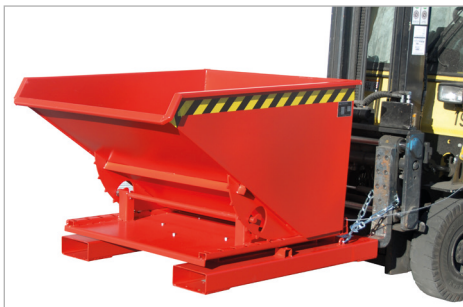
Typ 3S, Kipprichtung nach vorne