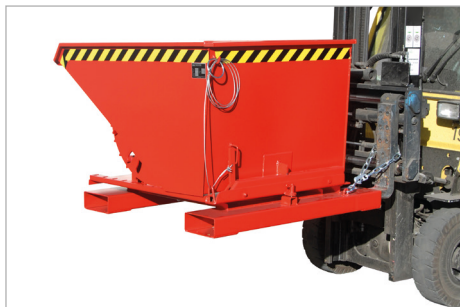
Typ 3S, Kipprichtung nach rechts