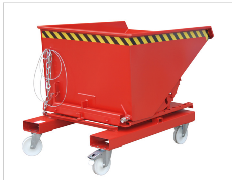
Typ S3S (siehe Seite 28) mit Rollen