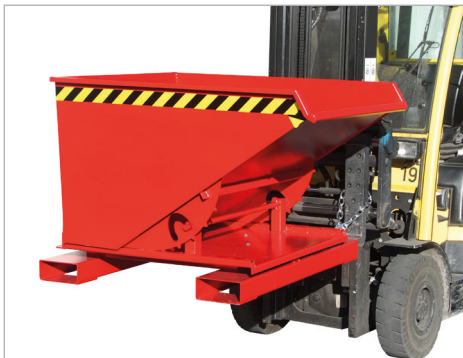
Typ 3S, Kipprichtung nach links