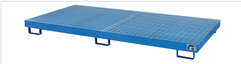
Regalwanne Typ RW-GR 2700-1