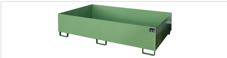
Regalwanne Typ RW 2200-2