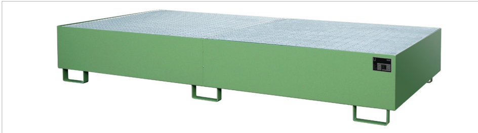
Regalwanne Typ RW-GR 2700-3