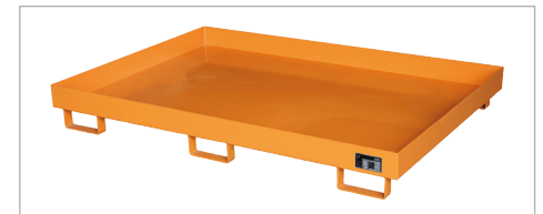
Regalwanne Typ RW 1800