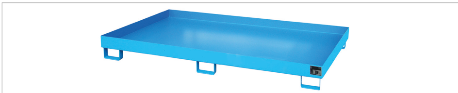
Regalwanne Typ RW-2200-1

Mit Hilfe von Regalwannen können auch bestehende Regalsysteme wirtschaftlich und schnell gesetzeskonform umgerüstet werden