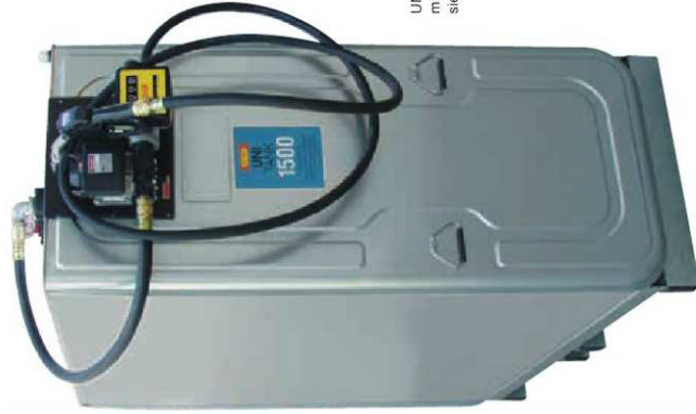
UNI-Tank 1500l mit Elektropumpe 50l/min siehe Seite 19