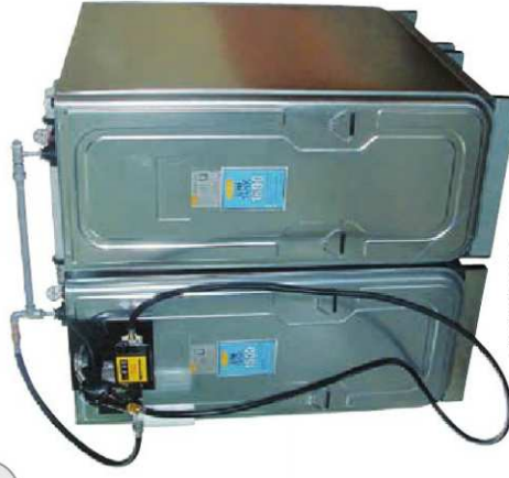
Dieseltankanlage mit 2 UNI-Tanks 1500l (Best.-Nr. 8822)