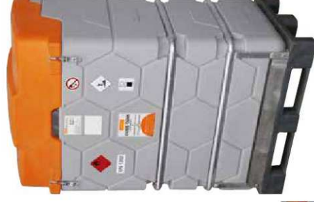
CUBE-Tank Mobil 1.000l mit Fußpalette und Schnellkupplung