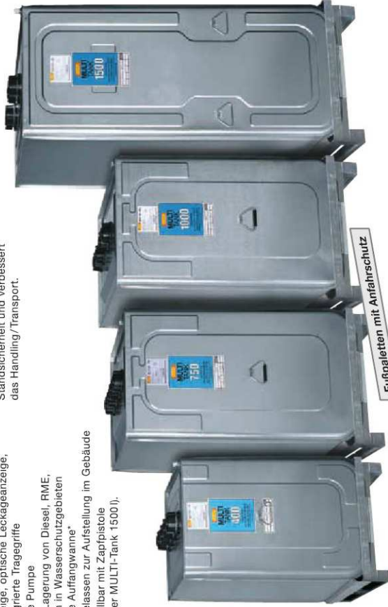
Fußpaletten mit Anfahrerschutz