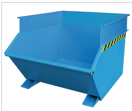
GU mit Aufsatzrahmen