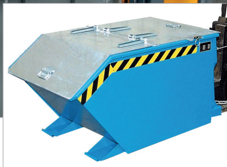
GU mit Deckel