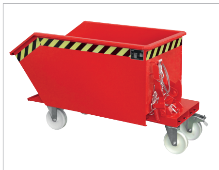
GU mit Rollen