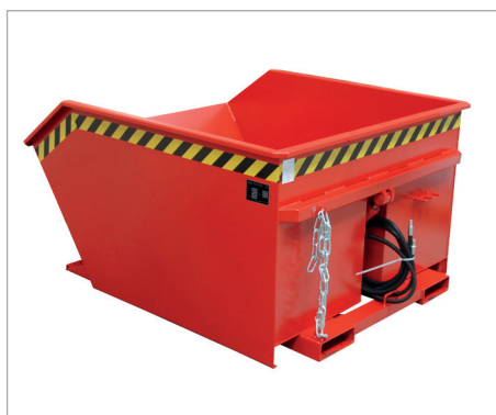
GU mit hydraulischer Kippvorrichtung