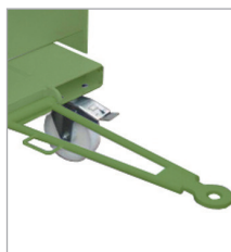
Anhängervorrichtung mit Deichsel