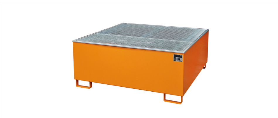
Typ AW 1000/PE