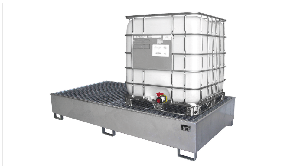
Typ AW 1000-2/PE