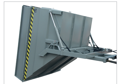
BKC mit hydraulischer Kippvorrichtung