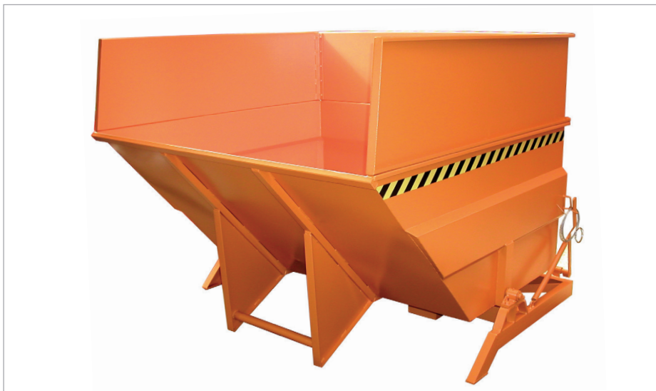
BKC mit Aufsatzrahmen