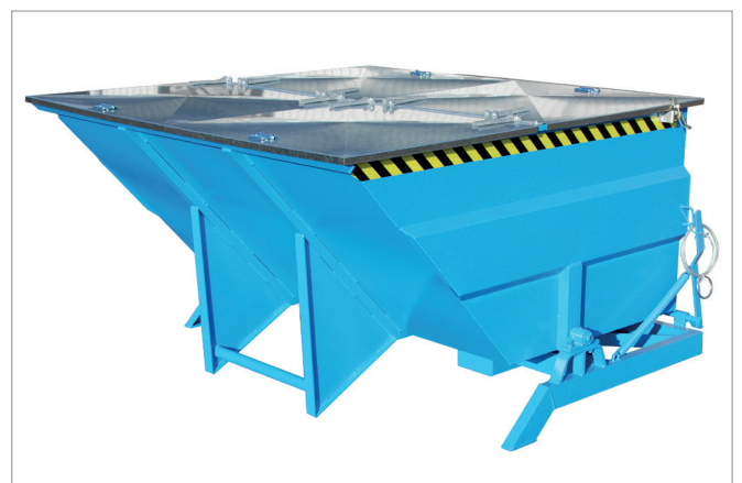
BKC mit Deckel